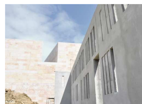
Regeneração Urbana: Pátio das Artes