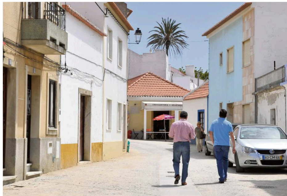
Regeneração Urbana: Rua Luís de Camões repavimentada

A fase de estruturas da obra da nova Escola Básica e Pré-Escola de Porto Covo está em conclusão. Este novo centro escolar, em construção junto à escola atual, será constituído por um edifício com quatro salas de aula para ensino básico e três para jardim-de-infância, com capacidade para 156 alunos, prevendo-se a continuação da utilização do refeitório existente. A obra, com conclusão prevista até ao final de 2012, representa um investimento de 1 milhão e 112 mil euros, participado por fundos FEDER / UE / INALENTEJO / QREN 2007-2013.