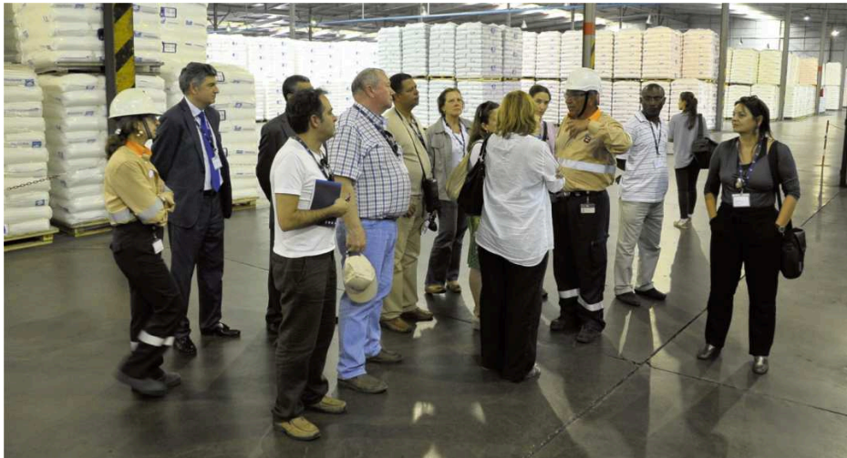
Visita à Repsol

Sines recebeu, nos dias 29 e 30 de junho, a visita de um grupo de correspondentes de órgãos de comunicação social estrangeiros em Portugal.