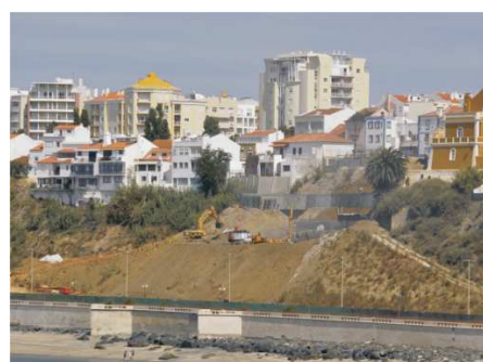
Regeneração Urbana: Contenção da falésia