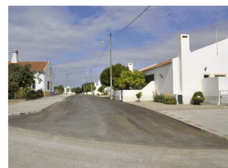
Arruamento no Bairro Nova da Provença