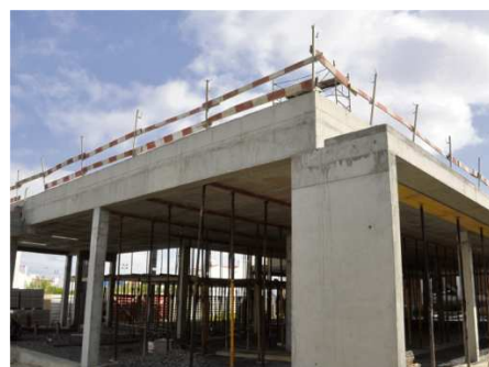
Nova Escola de Porto Covo