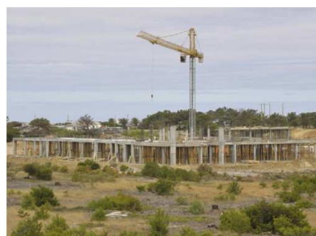
Novo Pavilhão de Desportos de Sines