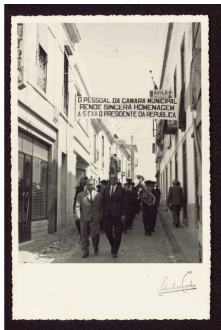
1969 - O cortejo da visita presidencial de Américo Tomás percorre a Rua Teófilo Braga.

No número passado deixámos a Rua Direita no início do século XX. Aproximava-se a implantação da República e rapidamente a Rua Direita, tal como outras ruas da vila, iria mudar de nome.