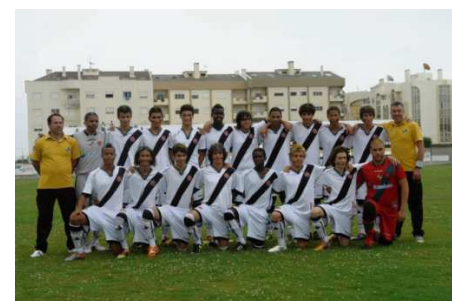
Equipa juvenil do Vasco da Gama