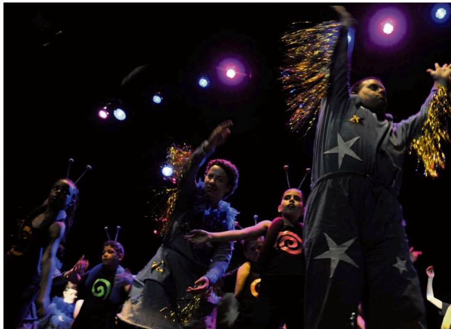
Espectáculo "Olá! Está Aí Alguém?"

Além da Semana da Educação Artística, o Centro de Artes de Sines organizou, no dia