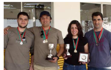
Atiradores da Associação de Caçadores

A equipa de juvenis de futebol do Vasco da Gama Atlético Clube sagrou-se campeã distrital da 2.ª divisão e garantiu a subida à 1.ª divisão. Durante a segunda fase da prova, que terminou no dia 10 de junho, a equipa sineense alcançou seis vitórias em seis jogos realizados e registou o melhor ataque (22 golos marcados) e a melhor defesa (10 golos sofridos) da competição.