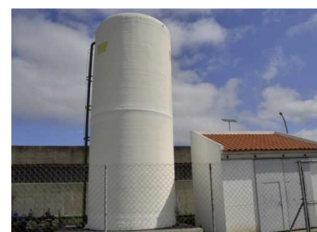
Reservatório Apoiado de S. Torpes