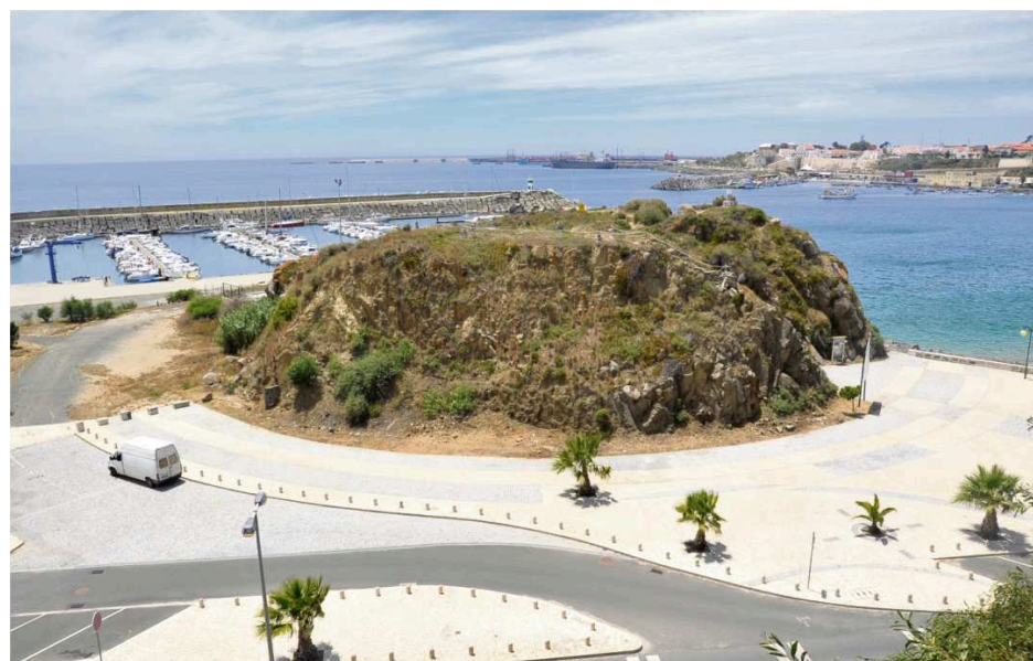
O palco da praia será este ano montado junto ao Pontal, devido às obras em curso na Av. Vasco da Gama

No dia inaugural, quinta-feira, 19 de julho, Sines acolhe a revelação Bombino , guitarrista e vocalista nascido no Níger, que representa a nova geração da música de tradição tuaregue, na linha de outros grandes grupos do deserto do Sahara, como Tinariwen e Tartit, que o festival recebeu em anos ante-