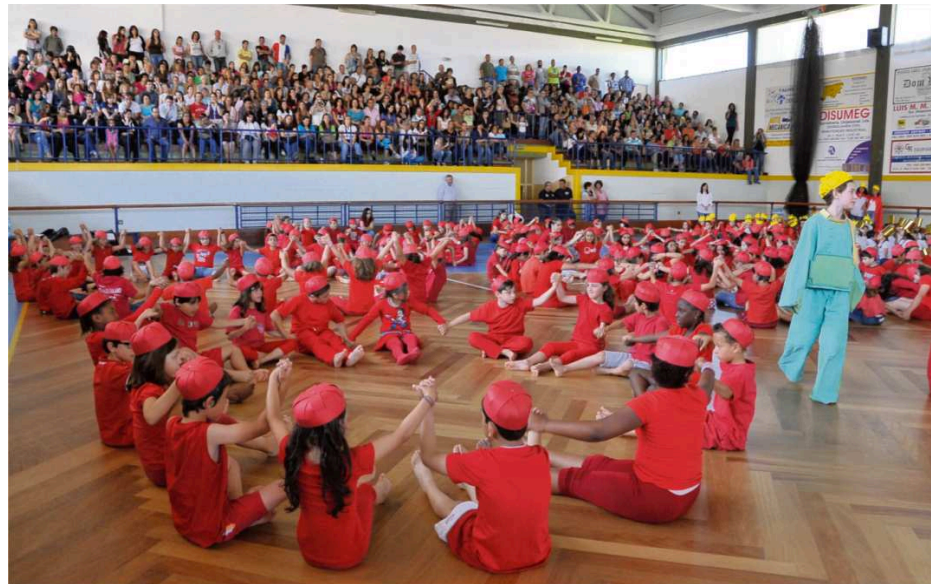
Apresentação final das AECs