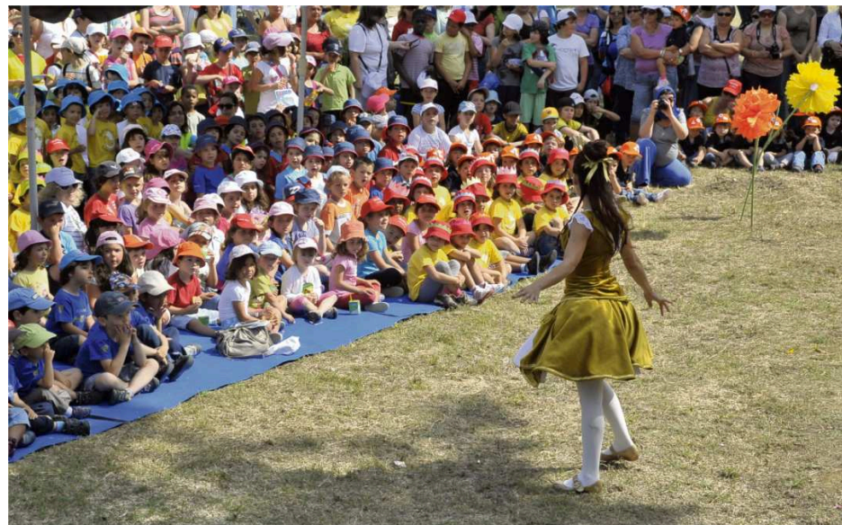
Dia Mundial da Criança

Do Dia Mundial da Criança às Férias Ativas, passando pelas várias iniciativas de demonstração das competências adquiridas nas Atividades de Enriquecimento Curricular e programa de educação física para a 2.ª infância, junho foi um mês de festa para a comunidade escolar.