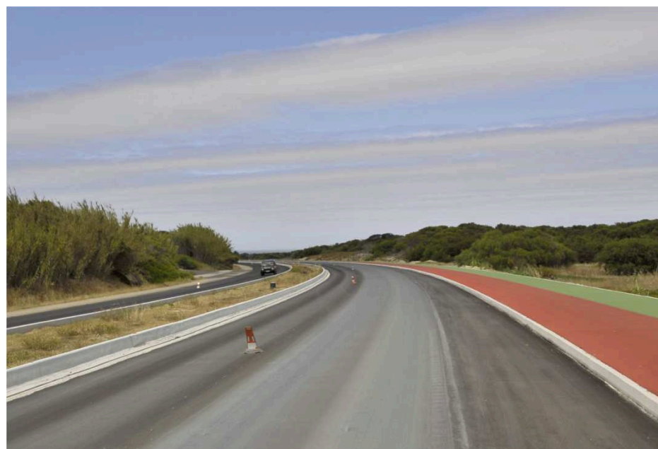
Avenida Panorâmica da Costa do Norte