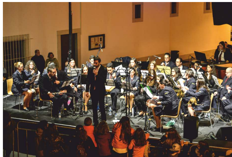
Concerto pela Banda Filarmónica da SMURSS

A pista destina-se a maiores de 6 anos, mas pode ser utilizada por crianças de idade inferior se acompanhadas pelos pais.