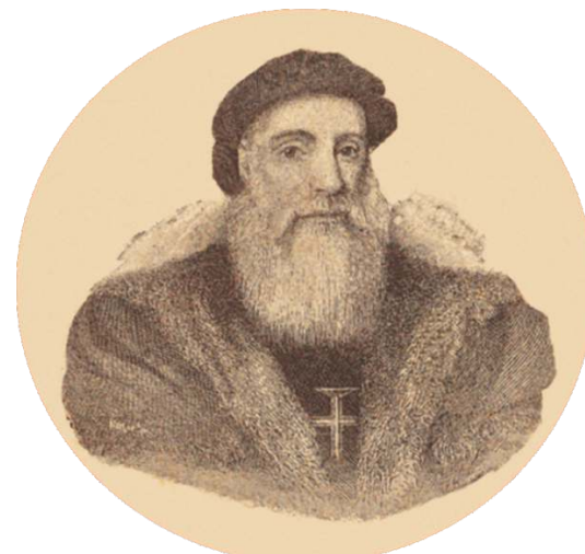
Vasco da Gama foi considerado, por 78% dos respondentes, o siniense com maior visibilidade