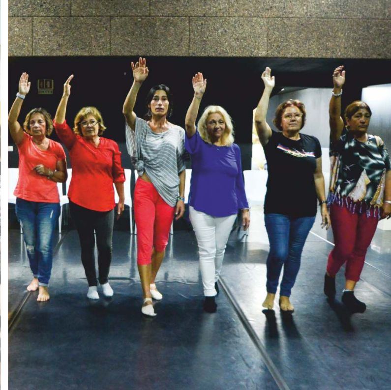
Dança no Centro de Artes de Sines