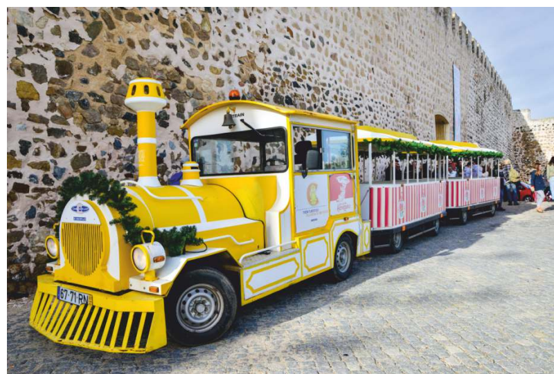
Comboio de Natal

Houve ainda um comboio de Natal, que levou os visitantes do Natal no Largo a um pequeno roteiro, gratuito, pelo centro histórico.