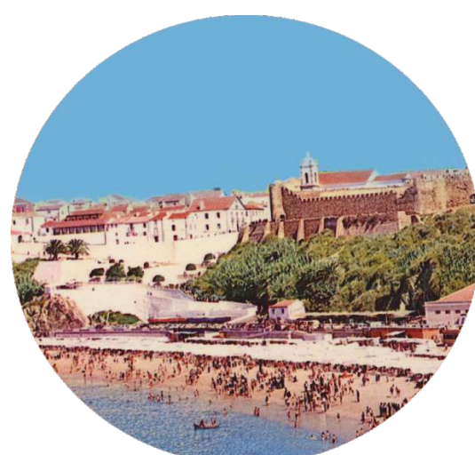
A «primeira memória de Sines» mais referida no inquérito foi a Praia Vasco da Gama