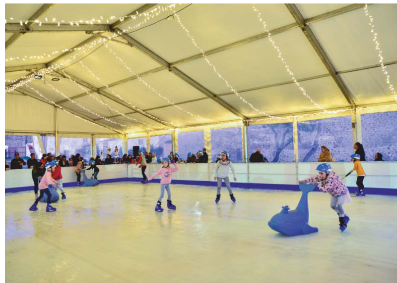
Pista de gelo no Castelo (instalada até 31 de dezembro)