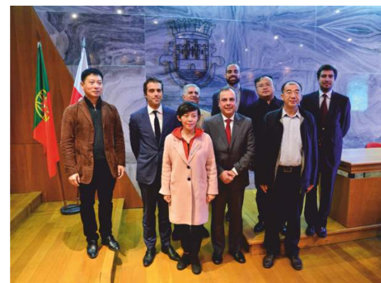
Receção à delegação da cidade chinesa de Beihai

Uma delegação da cidade portuária de Beihai, na província chinesa de Guangxi, visitou Sines nos dias 22 e 23 de novembro. O presidente da Câmara recebeu a delegação nos Paços do Concelho, onde os representantes dos dois municípios acordaram dar início ao processo que poderá conduzir à sua geminação. A visita desdobrou-se em três componentes: a oficial, a cultural e a empresarial. Na cultural, os representantes de Beihai visitaram o museu municipal, a Escola das Artes do Alentejo Litoral e o Centro de Artes de Sines. A visita económica levou a delegação à Zona Industrial e Logística de Sines, ao Sines Tecnopolo, ao Porto de Sines e à Associação de Armadores de Pesca.