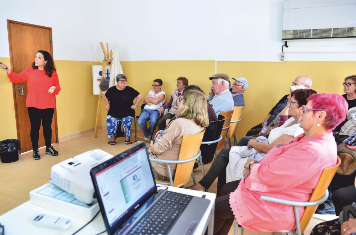
Ação de sensibilização sobre medicamentos fora de prazo, pela Farmácia Central