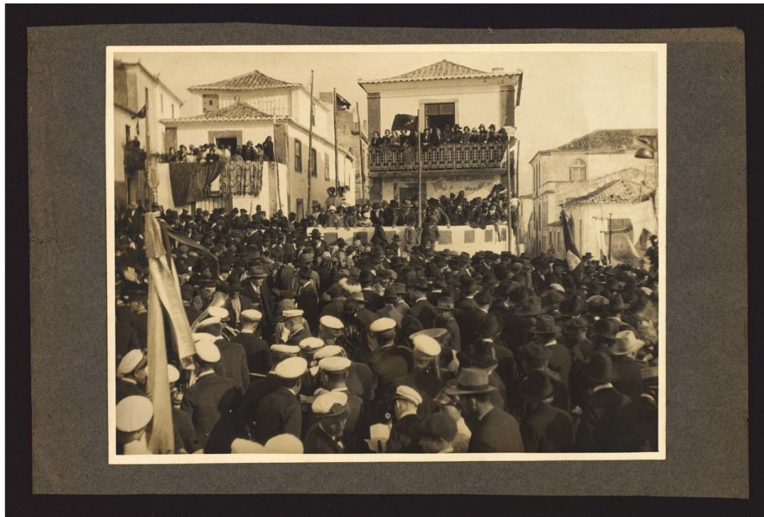
Uma cerimónia cívica no Largo dos Penedos, Sines. Arquivo Municipal de Sines, Coleção Mosaico das Memórias, documento emprestado pela Família Seixas Aguiar.

Os festejos em Sines realizaram-se em dezembro de 1924, o que se comprova pela notícia do jornal O Século de 28 de dezembro de 1924 (citado por João, 1999:487), e pelo voto de louvor ao desempenho da Comissão exarado em ata da Câmara Municipal de Sines de dia 31 de dezembro de 1924 (6). O programa incluiu um desfile cívico pelas ruas de Sines e o transporte do retrato de Vasco da Gama atribuído a Auguste Roquement (1804-1852), que