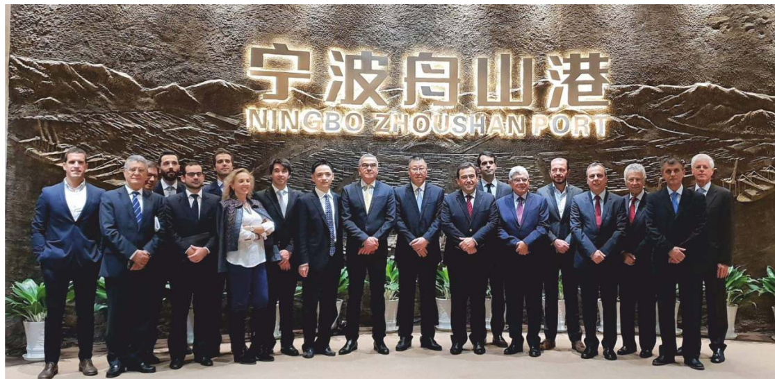
A visita de negócios à China passou pelo porto de Ningbo, que tem uma ligação direta ao porto de Sines

Na primeira semana de novembro, o presidente da Câmara e os seus homólogos do Alentejo Litoral participaram numa viagem de negócios à China, no âmbito do projeto Alentejo Global Invest. Alicerçada nas infraestruturas de grande porte e setores chave do Alentejo, a missão visou a atração de investimento estrangeiro e a consolidação da competitividade da região. Para o nosso concelho, foi muito importante a visita à cidade de Ningbo, cujo porto tem uma ligação direta com o porto de Sines. O projeto Alentejo Global Invest tem como promotores a ADRAL, o PACT - Parque de Ciência e Tecnologia do Alentejo e a ERT Alentejo. Conta como parceiros a CCDR-A, as comunidades intermunicipais, a EDIA e a aicep Global Parques.