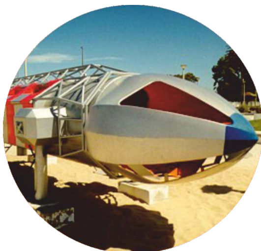
A «nave do IOS» foi citada por 47% das pessoas como o elemento mais significativo para a memória comum