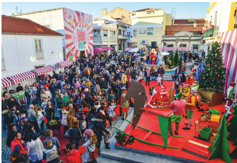
Praça Tomás Ribeiro decorada para o Natal no Largo

A Câmara Municipal de Sines reforça a programação de Natal para animação da cidade, atração de visitantes e dinamização do comércio